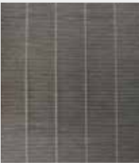
मध्यम गंदा एचईपीए फिल्टर