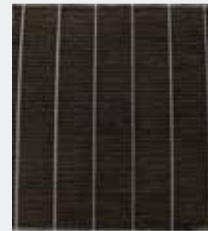
अधिक गंदा एचईपीए फिल्टर