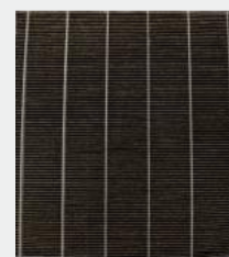
HEAVILY SOILED HEPA FILTER