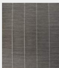
MEDIUM SOILED HEPA FILTER